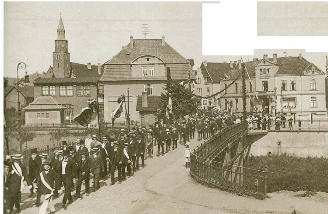
50 jähriges Stiftungsfest des Turnvereins, 1913

Die erste Vereinsfahne wurde am 8.5.1864 feierlich eingeweiht. Bestickt und mit Inschrift versehen hatten sie zahlreiche Frauen der Vereinsmitglieder. Diese Fahne ist heute noch in unserem Besitz, worauf