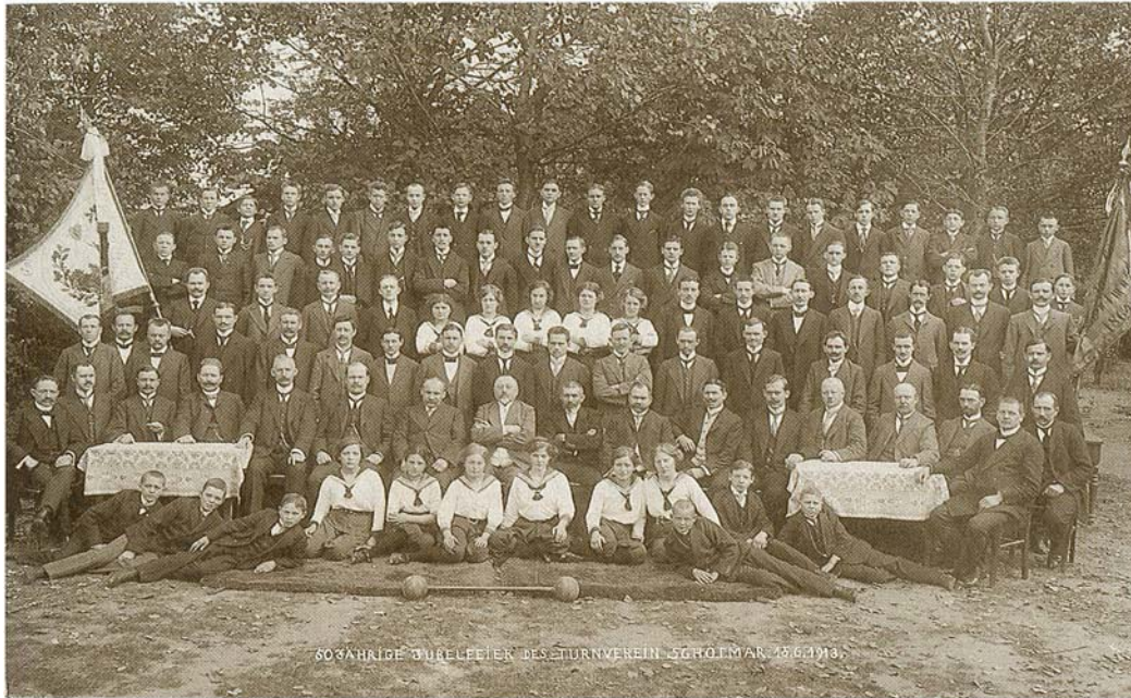
50 jährige Jubelfeier des Turnverein Schötmar am 15. Juni 1913

wir besonders stolz sind. In den Vereinsannalen liest man mit einem gewissen Schmunzeln über die Aktivitäten der Frauen: "Um sich gegenüber den beteiligten Damen erkenntlich zu erweisen, wurde beschlossen, dass sie zu den Vereinsfestlichkeiten freien Eintritt, bei Verheiratung ein Ständchen und bei Beerdigung feierlichen Grabgesang erhalten sollten".