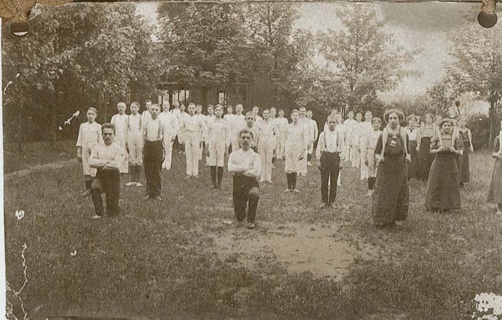
Jubiläumsbilder aus dem "Tivoli-Garten"