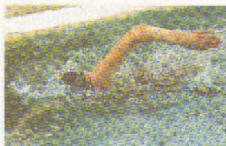
Antonia Graw vom veranstaltenden Verein TG Schötmar erreichte über 400 Meter Freistil Platz 6 und über 800 Meter Freistil Platz 9.