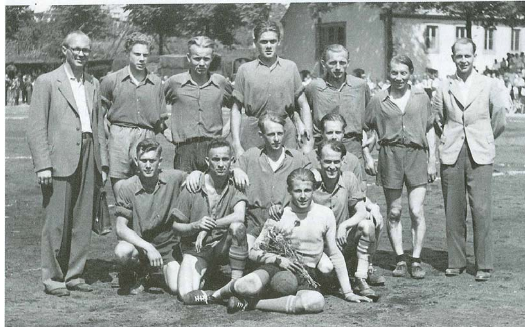
Die erste Handball-Mannschaft errang 1947 den Wanderpokal "Lippische Rose"

Die Einwohnerzahl Schötmars wuchs, bedingt durch den Verlust der Ostgebiete, genau so an, wie die der anderen Orte und Gebiete, einer der Gründe für den Mitgliederzuwachs der TG. Die Einordnung der "Neuen" verlief, wie nicht anders zu erwarten, problemlos.